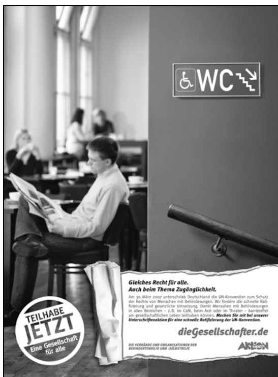
Europäischer Protesttag a la 2008: dieGesellschafter postulieren die barrierefreie Zugänglichkeit.

Muss er/sie nicht behindert sein, um den Nachteilsausgleich in Anspruch nehmen zu können? Welcher Arzt, Psychologe diagnostiziert die Behinderung? Welches Amt, welche Versicherung entscheidet über die Gewährung einer Ausgleichsleistung? Welcher Richter wird angerufen, wenn eine